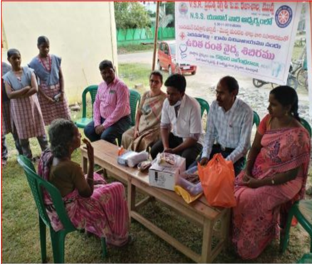
Free Medical Camp (Dental)