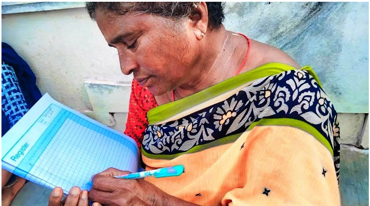
After Completion of the Adult Literacy Program the illiterate women putting signature in the register.