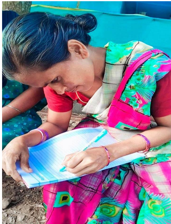
After Completion of the Adult Literacy Program the illiterate women putting signature in the register.