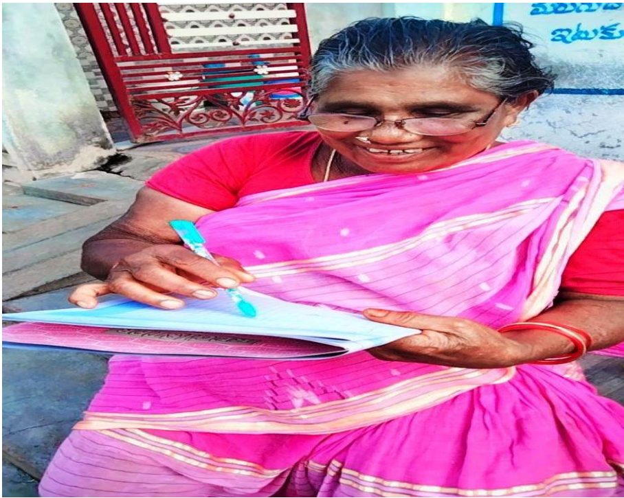
After Completion of the Adult Literacy Program the illiterate women putting signature in the register.