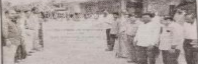
పెడసనగల్లులో ఎన్ఎస్ఎస్ శిబిరం.

ప్రజాశక్తి - మొదటి పెడసనగల్లు వద్దలోని పెడసనగల్లు గ్రామంలో మొదటి ఎన్ఎస్ఎస్ శిబిరం ఏర్పడింది. ఈ కార్యక్రమం కారణంగా పెడసనగల్లు గ్రామంలో ఎన్ఎస్ఎస్ శిబిరం ఏర్పడింది. ఈ కార్యక్రమం కారణంగా పెడసనగల్లు గ్రామంలో ఎన్ఎస్ఎస్ శిబిరం ఏర్పడింది.