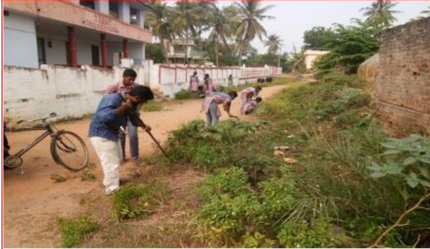
Swachcha Bharat, Clean and Green Activity

Swachcha Bharat, Clean and Green Activity: This was carried out in premises of Pedasanagallu Village in the afternoon . e) The school campus was cleaned by NSS Volunteers f) The library premises was cleaned by NSS Volunteers.