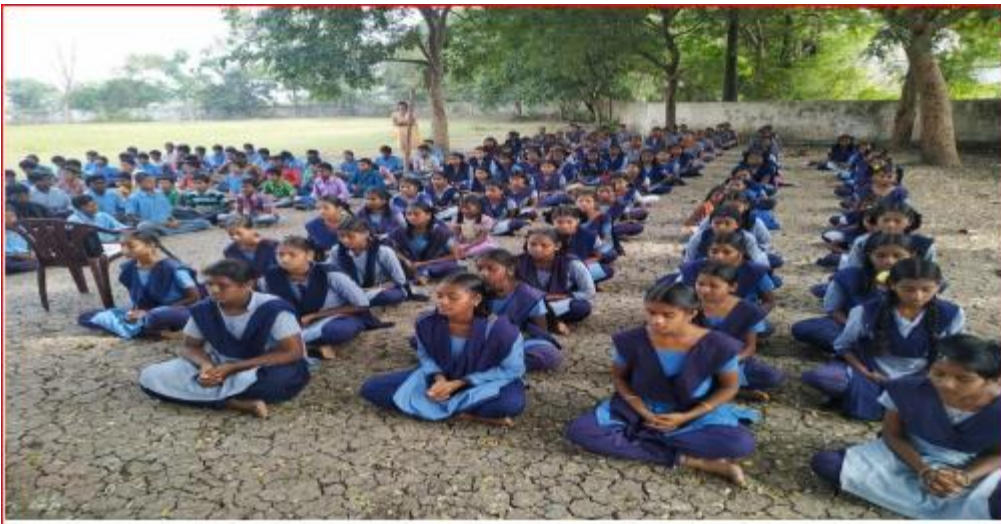
Meditation Class to Student of Z.P.P. High School