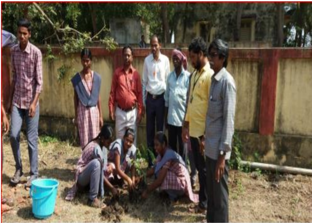
Vanam – Manam Activity