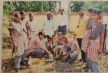
మొక్కలు నాటుతున్న ఎన్ఎన్ఎన్ వాలంటీర్లు

పెదనగల్లు(బొబిలి పూర్వ), రూప్యకూడ : వాతావరణ కాలుష్యం ముందుకొస్తున్న ఈ కరుణలో మానవ మనుగడకు మొక్కలే ఆధారమని, వాటిని తాదా వెంకటేశ్వరం ప్రతి పోయి బాధ్యత అని స్థానిక ప్రజలు యిది కీలక గోసాలక్ష్మి పుష్కరం కై ప్రజ్వలం