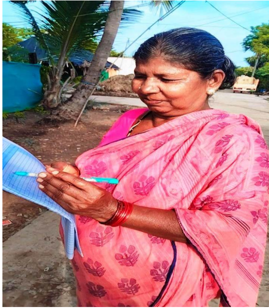
After Completion of the Adult Literacy Program the illiterate women putting signature in the register.