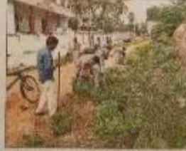
మొదటిసారి చెత్త తొలగింపు విద్యార్థులు

పెదసనగల్లు (కూచిపూడి), స్కూలుకుడి : 2 చెత్త తొలగింపులో మొదట పామర్రు ప్రభుత్వ ద్వారా చేత కార్యాచరణ ఎన్ఎస్ఎస్ శిబిరులు కొనసాగించి తీరింది. యిద