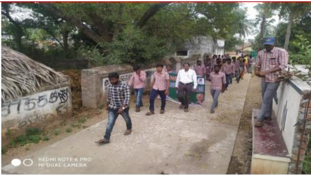
Awareness programme on AIDS/HIV at Pedasanagallu village